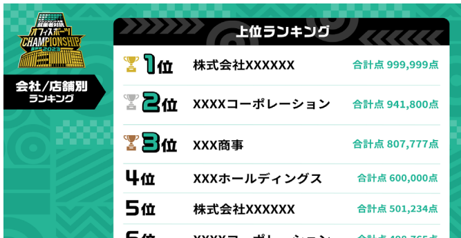
(ランキング表示イメージ)

「オフィススポーツ CHAMPIONSHIP2025」は、最大3人1チームで参加でき、新競技「晴レテクレ射撃」を含む全3競技の得点総計に応じて、チーム別ランキングと会社/店舗別ランキングを特設サイトや場内サイネージでリアルタイムに発表していきます。自分の会社「以外の人」にチームに加わってもらう「助っ人ルール」もあり、助っ人を含め4人で参加するとポイントアップします。また、上位チームには豪華景品も用意しています。昨年1位となったイベント参加企業はこの「助っ人ルール」を活用し、昨年上位入賞企業との協働で優勝を果たしました。優勝景品を助っ人の会社に配るなど、イベント後も会社間の交流が生まれています。