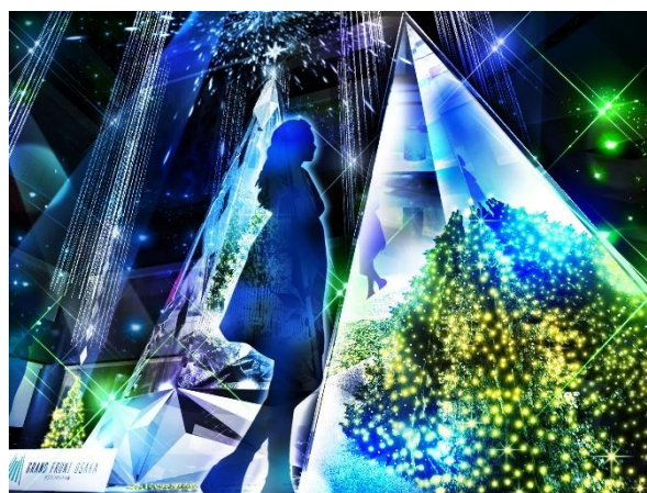
内部の色が変化し、表情を変える「Infinity Wish Tree」(イメージ)