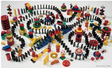
1巻:おもちゃばこ ドミノは うまく たおれるか