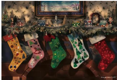
4巻:サンタクロース くつしたさげて まってます