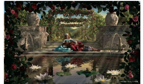
5巻:むかしむかし びじょとやじゅう