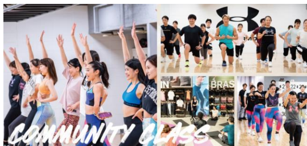
▲アンダーアーマーコミュニティクラス /UNDER ARMOUR BRAND HOUSE