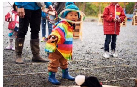
▲また！？CHUMS大阪店のブービー大脱走