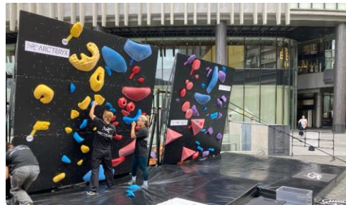
▲クライミングチャレンジ /ARC'TERYX