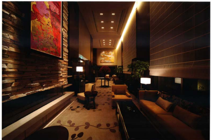
レセプションハウスでも体感できる「ザ・レセプション」(左)と「ザ・リビング」(右)